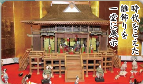
時代をこえた 雛飾りを 一堂に展示